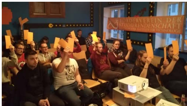
Abstimmung während der Mitgliederversammlung.

Die Projekte, deren Förderung von der Mitgliederversammlung beschlossen wurde, können dem Kapitel Geförderte Projekte entnommen werden.