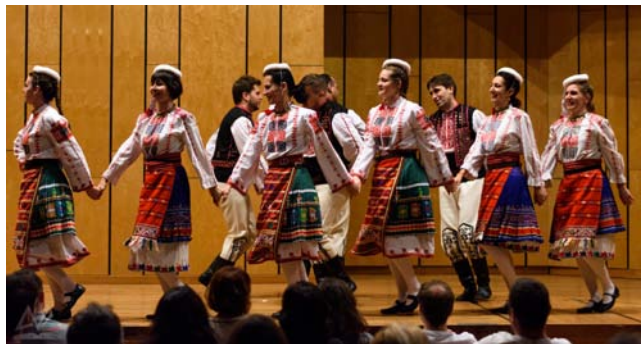
Bulgarischer Volkstanz.

Die Veranstaltung wurde von allen Altersgruppen und verschiedenen Nationalitäten beliebt. Wir freuen uns jedes Jahr auf ein multikulturelles und diverses Publikum, wo jeder sich wohlfühlt. Die Anzahl des Publikums war ungefähr 150. Ein großer Anteil davon waren bulgarischen und deutschen Studierende der KIT. Dieser Art von Veranstaltungen ermöglicht eine tiefere Verständigung zwischen den beiden Kulturen.